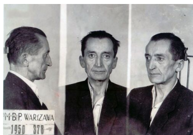
Zdjęcia sygnalityczne Augusta Emila Fieldorfa z aresztu MBP przy ul. Koszykowej, 1950 r.

W siedemnastomiesięcznym śledztwie nie oszczędzono Fieldorfowi niczego: tortur, oszczerczych zeznań wymuszonych na dawnych podkomendnych, kłamstw o aresztowaniu żony z córkami. Obiecywano natychmiastowe zwolnienie w zamian za ujawnienie archiwów Kedywu lub za wydanie do ukrywających się żołnierzy podziemia apelu o ujawnianie się. Odmawiając, zniweczył plany bezpieki i przesądził o swoim losie.