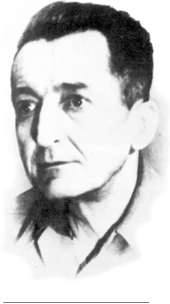
August Emil Fieldorf „Nil”, 1950