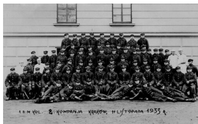
2. kompania 1. Batalionu Mostów Kolejowych, Kraków, 1933 r.

Życie rodzinne młodego oficera Wojska Polskiego w przedwojennym Krakowie można obejrzyć na licznych fotografiach oraz kliszach. Już wkrótce zostało ono jednak brutalnie przerwane przez wybuch II wojny światowej.