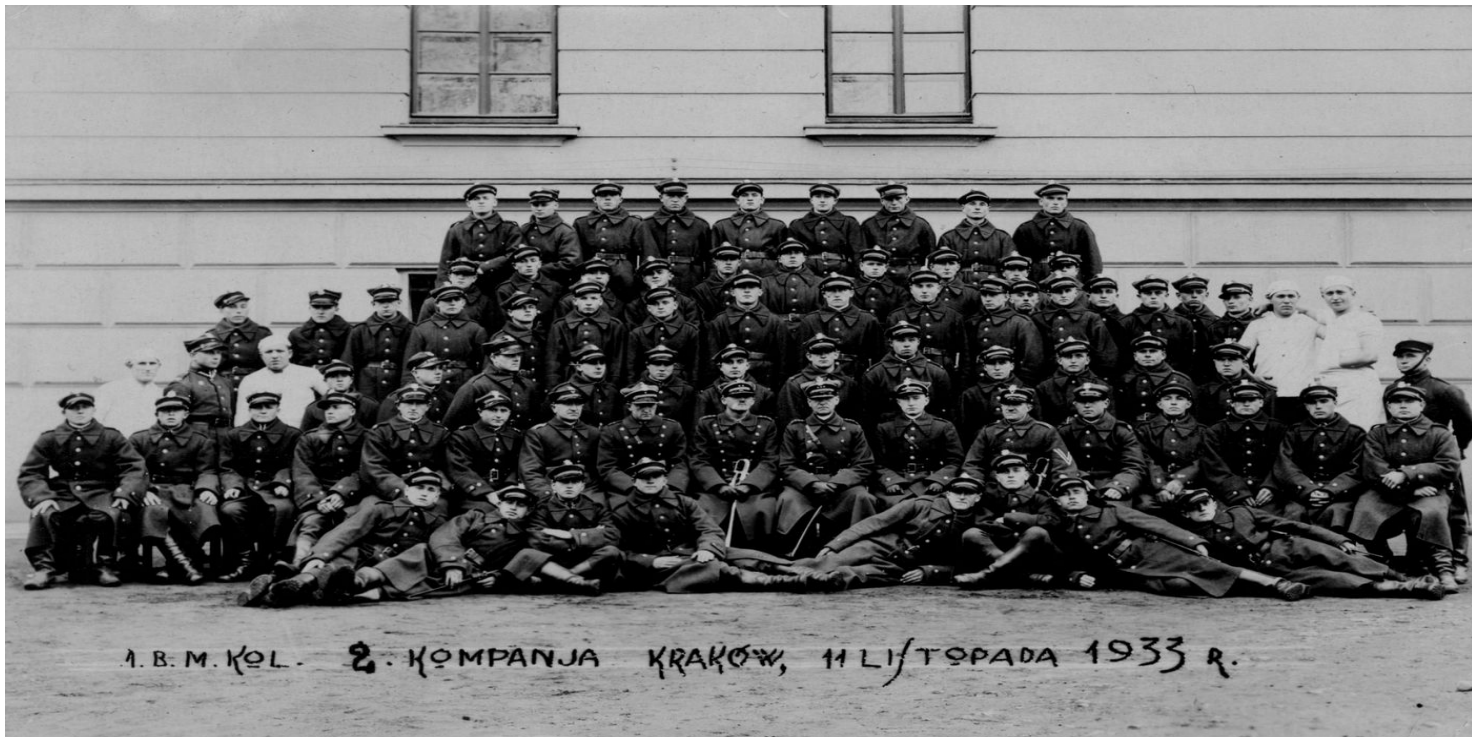
2. kompania 1. Batalionu Mostów Kolejowych, Kraków, 1933 r.

https://przystanekhistoria.pl/pa2/tematy/zbrodnie-katynska/104392,Pamiatki-po-por-Romanie-Stachanskim.html