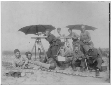
Zajęcia topograficzne w Szkole Podchorążych Inżynierii

Prawdopodobnie Stachański został początkowo przydzielony do służby w 2. kompanii 1. Batalionu Mostów Kolejowych. Natomiast po awansie na porucznika (1935/1936) dowodził plutonem podchorążych rezerwy, wchodzącym w skład kompani szkolnej, na której czele stał mjr Tadeusz Franciszek Forys. Z tego okresu zachowała się zgromadzona przez niego bogata dokumentacja szkoleniowa, obejmująca m.in. rysunki techniczne, mapy, czy też notatki do prowadzonych ćwiczeń wojskowych. Uwagę zwraca również obszerny album fotograficzny pt. „Most drogowy I. klasy na rz. Niemen w Bielicy wybudowany przez 1 Baon Mostów Kolejowych w 1935 r.”. Stachański brał udział w budowie przeprawy nieopodal Lidy.