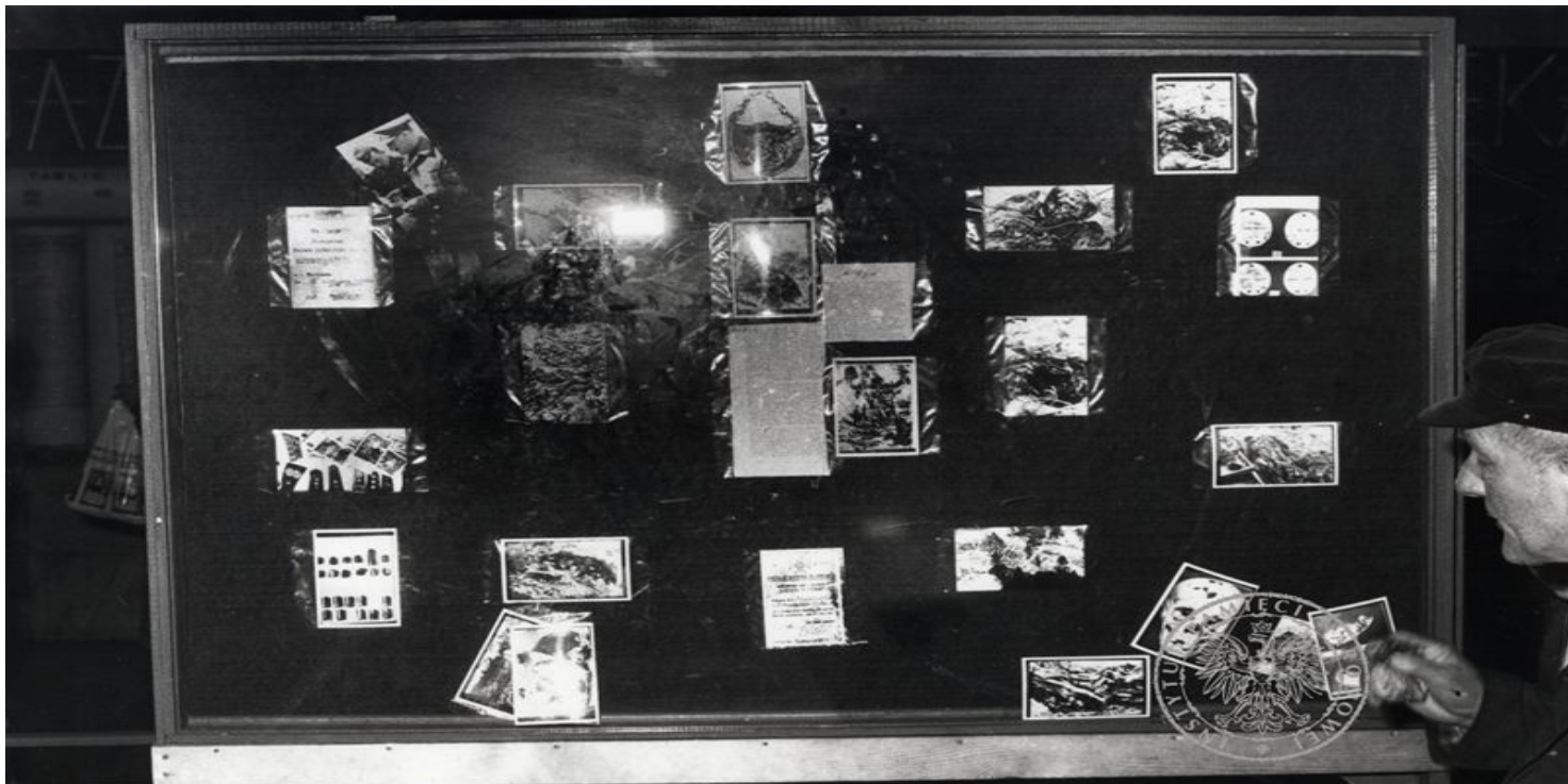
Dworzec kolejowy w Poznaniu. Gablota, w której „Solidarność” umieściła materiały związane z mordem katyńskim. Fotografia wykonana przez funkcjonariuszy SB (z zasobu IPN)

https://przystanekhistoria.pl/pa2/tematy/zbrodnia-katynska/100059,NSZZ-Solidarnosc-a-Zbrodnia-Katynska.html