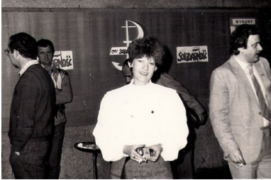
Spotkanie Komitetu Obywatelskiego „Solidarność” w Starachowicach.

parlamencie. Wokół takich założeń politycznych skupiła się duża grupa ludzi i to właśnie umożliwiło powstanie zorganizowanej struktury KPN-u w Kielcach.