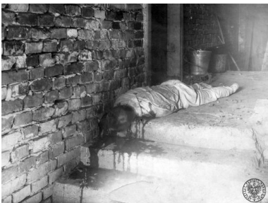
Zwłoki Józefa Hachlicy, prezesa Koła PSL w Krakowie-Prokocimiu, zamordowanego 22 października 1946 r. przed drzwiami własnego domu

Wybory wyznaczone zostały ostatecznie na 19 stycznia 1947 r. Poprzedziły je prowokacje polityczne, w rodzaju mającego odwrócić uwagę od wyników referendum pogromu kieleckiego, podczas którego 4 lipca 1946 r. zginęło 40 Żydów. Wzmagająca się fala politycznego terroru, wsparta postanowieniami wprowadzonego w życie w czerwcu 1946 r. tzw. małego kodeksu karnego. Tłumieniu wystąpień opozycji, zwłaszcza na łamach prasowych, służyła cenzura prewencyjna, faktycznie istniejąca od połowy 1945 r., formalnie zalegalizowana po powołaniu do życia we wrześniu 1946 r. Głównego Urzędu Kontroli Prasy, Publikacji i Widowisk. Rozbijano wiece organizowane przez opozycję. Masowo aresztowano działaczy, w tym kandydatów do parlamentu. Uciekano się do skrytobójczych mordów (przed wyborami zamordowano ponad stu działaczy PSL).