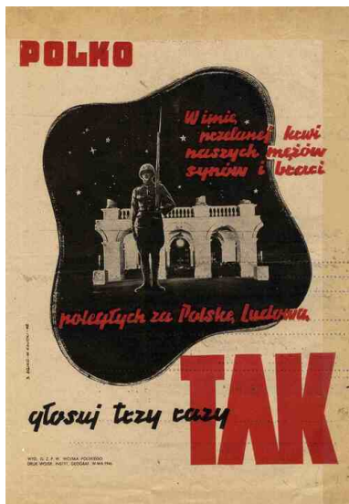
Plakat wzywający do głosowania „3 razy TAK” w referendum 30 czerwca 1946 r.

W niekorzystnej dla siebie sytuacji komuniści rozpoczęli grę o czas. Był im on potrzebny dla spreparowania aktu wyborczego. Wysunięty przez PPR w końcu marca pomysł „ludowego referendum” stał się przedwyborczą próbą generalną. Pytania skonstruowano bardzo sprytnie. Domagano się odpowiedzi na pytanie o ewentualne zniesienie wyższej izby parlamentu, senatu, wyrażenie woli co do kontynuowania i utrwalenia społeczno-gospodarczych reform, wreszcie stabilizacji granicy na Odrze i Nysie Łużyckiej.