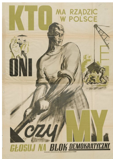
Plakat wyborczy tzw. Bloku Demokratycznego

agenturalną – pełnił, mający swą trybunę w uruchomionym w końcu listopada piśmie „Dziś i Jutro”, Bolesław Piasecki.