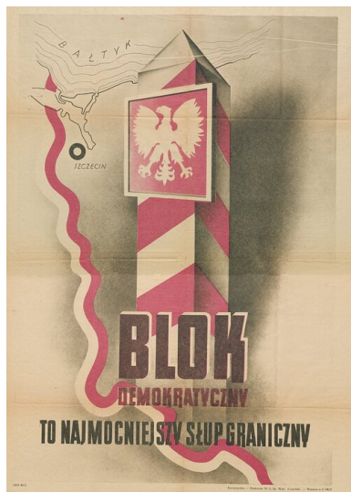
Plakat wyborczy tzw. Bloku Demokratycznego

Komuniści i związani z nimi figuranci rozpoczęli grę przedwyborczą w końcu 1945 r. Pierwszym pomysłem,