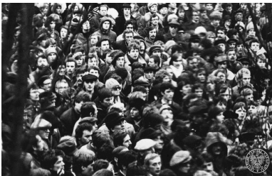
Manifestacja grudniowa w 1979 r.

Dowiedzieliśmy się potem, że kolportowane są niezależne pisma, że bezpieczeństwo [SB] dokonało aresztowań. Bardzo nas to przestraszyło. Bardziej niż znane nam wcześniej działania Komitetu Obrony Robotników i może w założeniu szlachetna, ale odosobniona działalność młodych i starszych przedstawicieli kręgów intelektualnych wśród robotników Radomia, Ursusa i innych miejscowości dotkniętych represjami po czerwcu 1976 roku. Doniesienia naszej bezpieki o działalności Kuronia, Michnika, Modzelewskiego czy Moczulskiego nie robiły silniejszego wrażenia, jakby spowszedniały [...]. Nasi polscy przyjaciele całkowicie bagatelizowali te zjawiska jako marginesowe i radzili nam nie przywiązywać większej wagi do jakichś tam prasowych ataków na siły antysocjalistyczne. [...] Dopiero wiadomości o Wolnych Związkach Zawodowych zaalarmowały naszych szefów”.