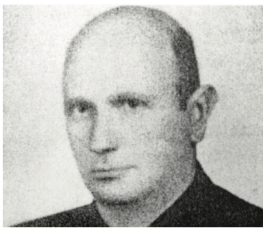
Kmdr por. Wacław Krzywiec