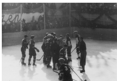
Dyskusja zawodników Polski i Czechosłowacji.

Oglądający spotkanie przedstawiciele poselstwa ČSR w Warszawie odnieśli wrażenie, że zachowanie publiczności miało charakter zorganizowanej kampanii. Kibiców nie potrafili uspokoić organizatorzy mistrzostw, tłumacząc swą bezradność faktem uszkodzenia megafonu, co uniemożliwiało zapanowanie nad rozentuzjasmowanym tłumem.