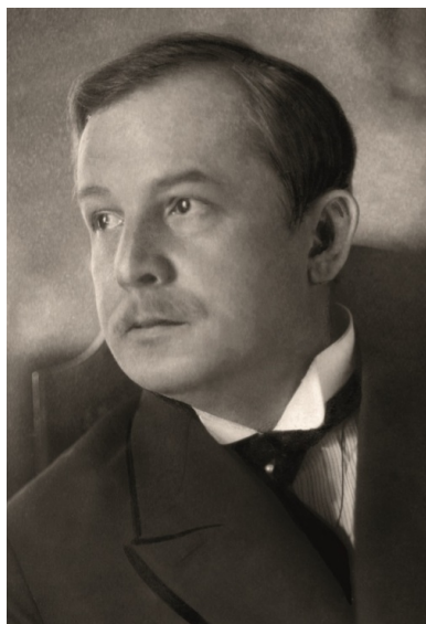
Wojciech Korfanty w okresie plebiscytu.

Niespełna miesiąc przed plebiscytem Korfanty głosił, że „swego tryumfu lud górnośląski jest pewien, jego zwycięstwo jest murowane”. Okazało się jednak inaczej.