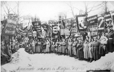
Demonstracja żołnierska przed Pałacem Taurydzkim, 1917 r.