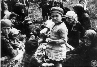
Grupa kobiet i dzieci z transportu Żydów z Węgier, uznanych za niezdolne do pracy, czeka na śmierć w pobliżu komór gazowych obozu zagłady KL Auschwitz-Birkenau, maj 1944 r.

Naloty z pewnością przyniosłyby liczne ofiary wśród więźniów, ale uratowałyby, jak sędzę, setki tysięcy istnień ludzkich.