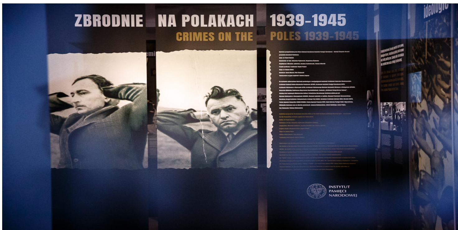
Wystawa IPN „Zbrodnie na Polakach 1939-1945” – Warszawa, 2019 r.

https://przystanekhistoria.pl/pa2/tematy/obozy-koncentracyjne/90931,Aresztowania-i-deportacje-do-obozow-koncentracyjnych-inteligencji-polskiej-z-zie.html