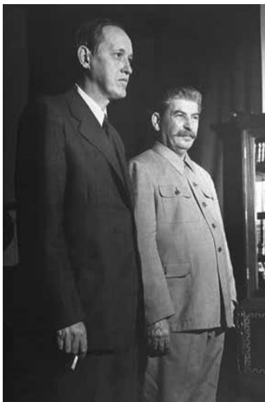
Harry Hopkins i Józef Stalin, 1941