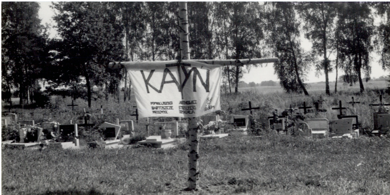
Fotografia operacyjna SB wykonana na cmentarzu w Siedlisku w dniu „ujawnienia” katyńskiego krzyża, 31 VII 1988 r., ze zb. Archiwum IPN w Poznaniu

https://przystanekhistoria.pl/pa2/tematy/aparat-bezpieczenstwa/91178,Plotno-z-katynskiego-krzyza.html