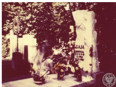
Anna Walentynowicz przy grobie Grażyny Gaji Boguckiej - Kuroń na Warszawskich Powązkach.

Według oceny Służby Bezpieczeństwa miało w nich uczestniczyć około 2,5 tys. osób, a przebieg uroczystości filmowało siedem zachodnich ekip telewizyjnych.