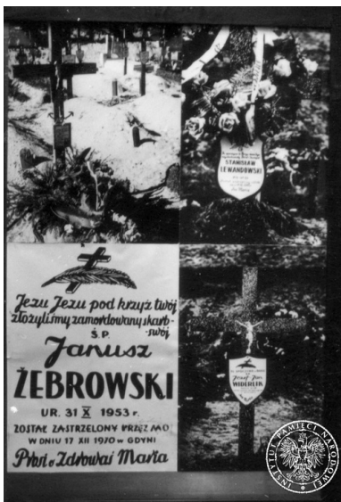
Plansza z wystawy ustawionej w grudniu 1980 r. w Gdańsku, zawierająca zdjęcia grobów zabitych osób w czasie Grudnia'70.

„jeśli nie jesteście zainteresowani, to syn zostanie pochowany w prześcieradle i nawet nie będziecie wiedzieli gdzie leży”.