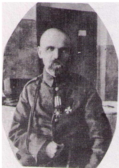
Gen. Mychajło Omelanowycz-Pawłenko

25 kwietnia połączone siły polsko-ukraińskie (60 tys. żołnierzy polskich i 5 tys. ukraińskich płk. Udowyczenki) rozpoczęły ofensywę. W ciągu tygodnia wyparły one bolszewików z Żytomierza, Berdyczowa, Winnicy i 6 maja wkroczyły do Kijowa. Za Polakami do Kijowa przybyła ukraińska 6. Dywizja Strzelców. Rankiem 9 maja na Chreszczatyku odbyła się parada wojsk polskich i ukraińskich na cześć wyzwolenia stolicy Ukrainy.