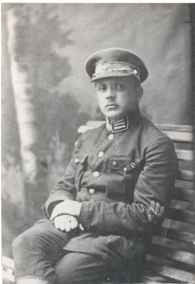
Płk. Ołeksandr Udowyczenko

W wyzwolonych powiatach rząd URL przeprowadził mobilizację, która zwiększyła łączną liczebność wojska do 40 tys., a stan bojowy do 14 tys. żołnierzy. Pozwoliło to uzupełnić istniejące jednostki i utworzyć nowe. Rozpoczęto odtwarzanie brygad zapasowych i formowanie wojsk pogranicznych. Na froncie pojawiły się też 1. Ekipaż (oddział pomocniczy) Floty, 1. Zaporoski Samodzielny Oddział Lotniczy i dywizjon samochodów pancernych, które zostały sformowane w Polsce.