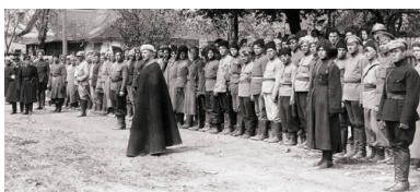
Symon Petlura (z lewej) dokonuje przeglądu oddziału Armii Czynnej URL, przed frontem oddziału gen. Iwan Omelanowycz-Pawłenko, Kijów, maj 1920 r.

Jednocześnie w Kamieńcu Podolskim, zajęтым przez polskie wojska, rozpoczęto formowanie 4. Brygady Strzelców, a na terenie „niczyich” powiatów mohylowskiego i jampolskiego – Samodzielnej Brygady Strzelców. Jednostki te 20 marca połączono w 2. Dywizję Strzelców pod dowództwem płk. Ołeksandra Udowyczenki. Także w tym przypadku Polacy wzięli na siebie zapewnienie potrzebnego sprzętu wojskowego.