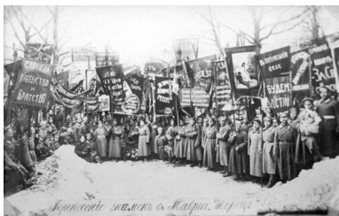
Demonstracja żołnierska przed Pałacem Taurydzkim, 1917 r.