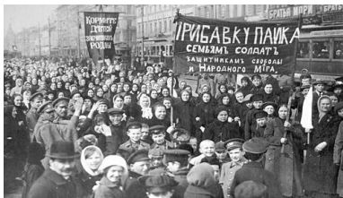
Demonstracja robotników z Zakładów Putiłowskich w Piotrogradzie, marzec 1917 r.

W tej sytuacji przed WKP(b) stało pytanie o przyszłość eksperymentu bolszewickiego. Odpowiedzią na nie była koncepcja budowy socjalizmu w obcym, kapitalistycznym okrążeniu jako systemu autarkicznego. Zwolennik tej koncepcji Józef Stalin, gotów był podjąć ryzyko budowy systemu socjalistycznego „w pojedynkę”. W ten sposób podał w wątpliwość marksistowską tezę o permanentnej rewolucji. Przy tym należy zaznaczyć, że przyszły dyktator nigdy nie wątpił w zasadność rewolucji, za Marksem i Engelsem był przekonany w jej nieuchronności.